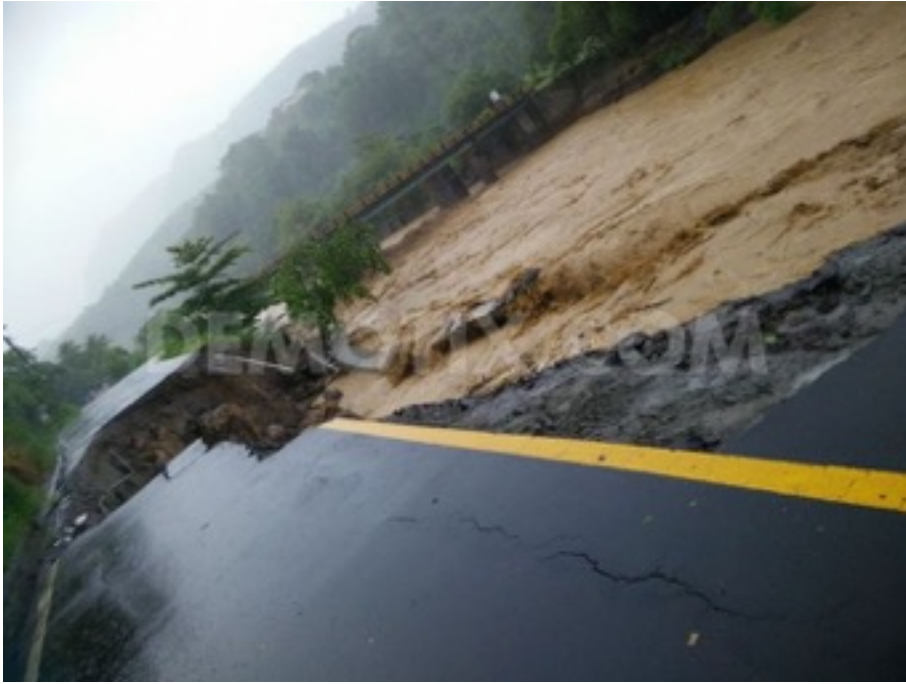
Hoofdweg naast Layou River