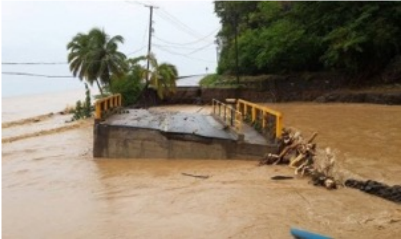
Brug hoofdweg naar Portsmouth