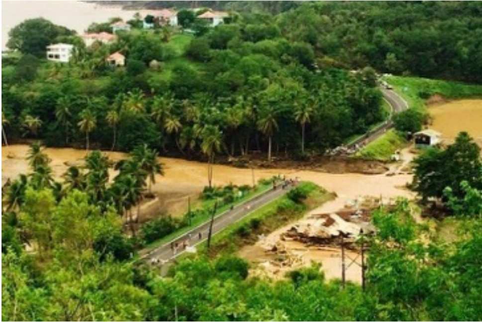
Hoofdweg vlak voor Portsmouth