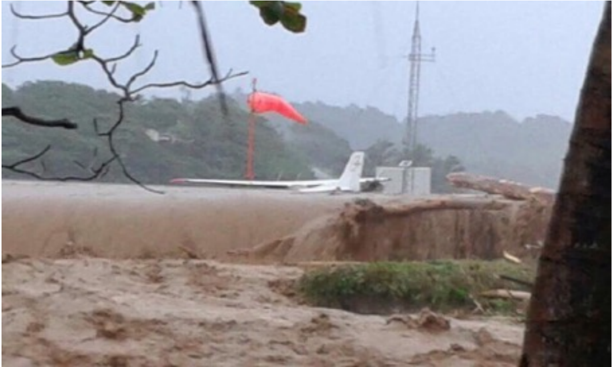
Melville Hall vliegveld